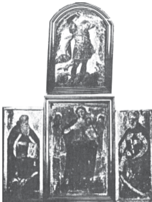
Fig. 4. Il Polittico all'epoca del trasferimento (elaborazione da GRIECO, Buccino , cit. [9], pp. 73-74)