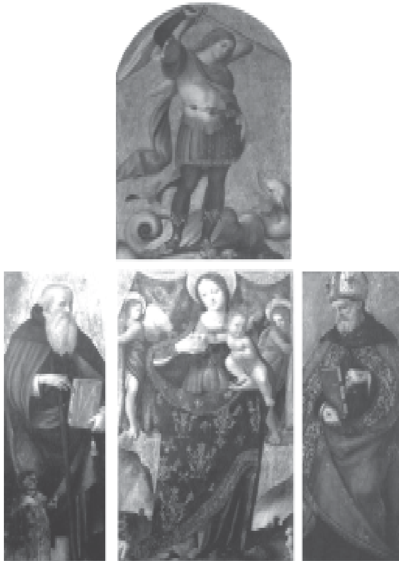
Fig. 1. Andrea Sabatini - Polittico di Buccino