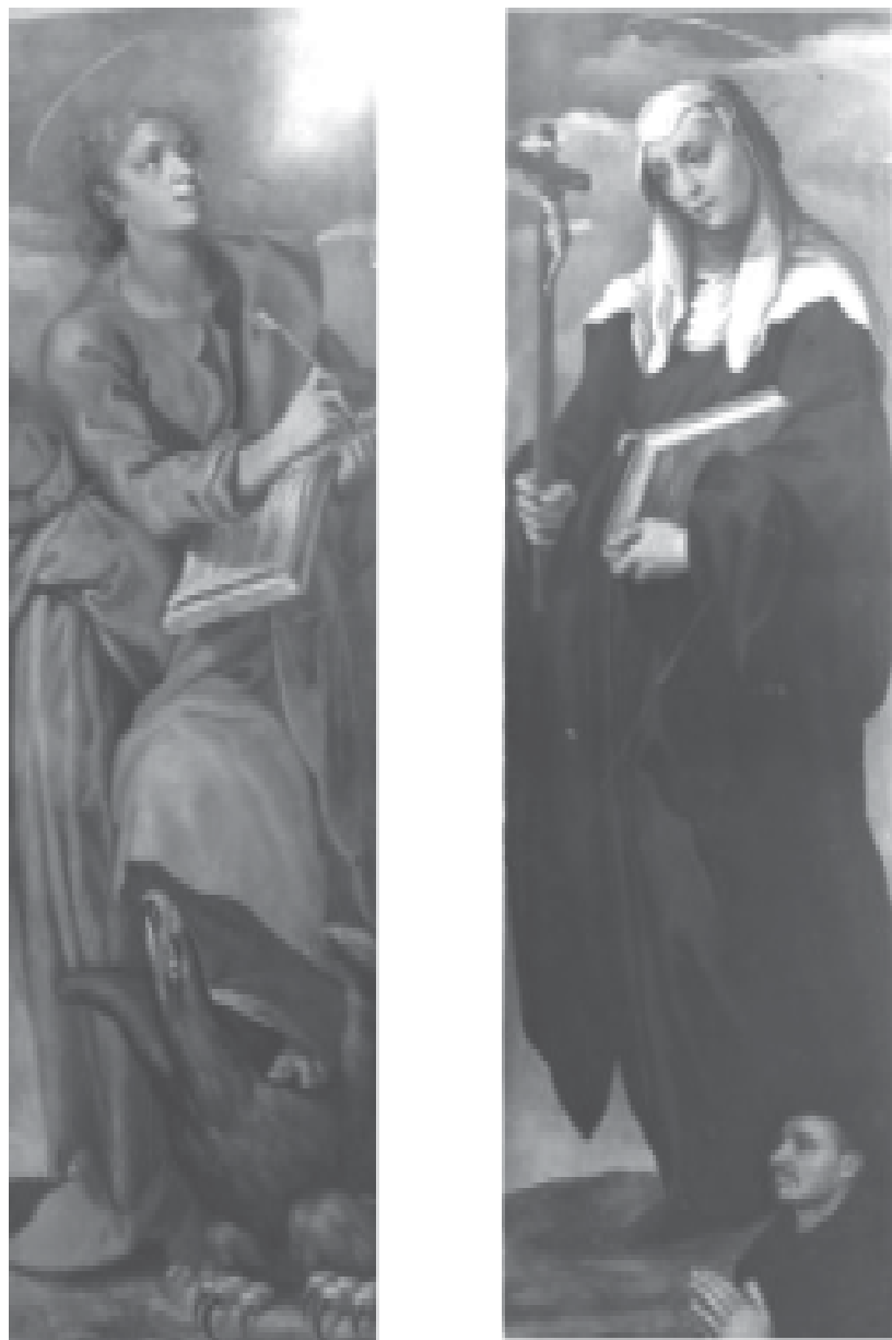
Fig. 2. San Giovanni evangelista (a sinistra). Santa Monica con il committente (a destra)