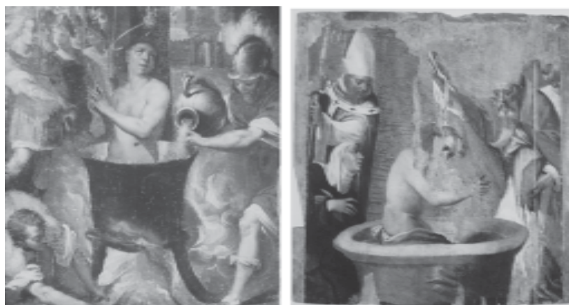
Fig. 3. Martirio di S. Giovanni Evangelista (a sinistra). Battesimo di S. Agostino (a destra)