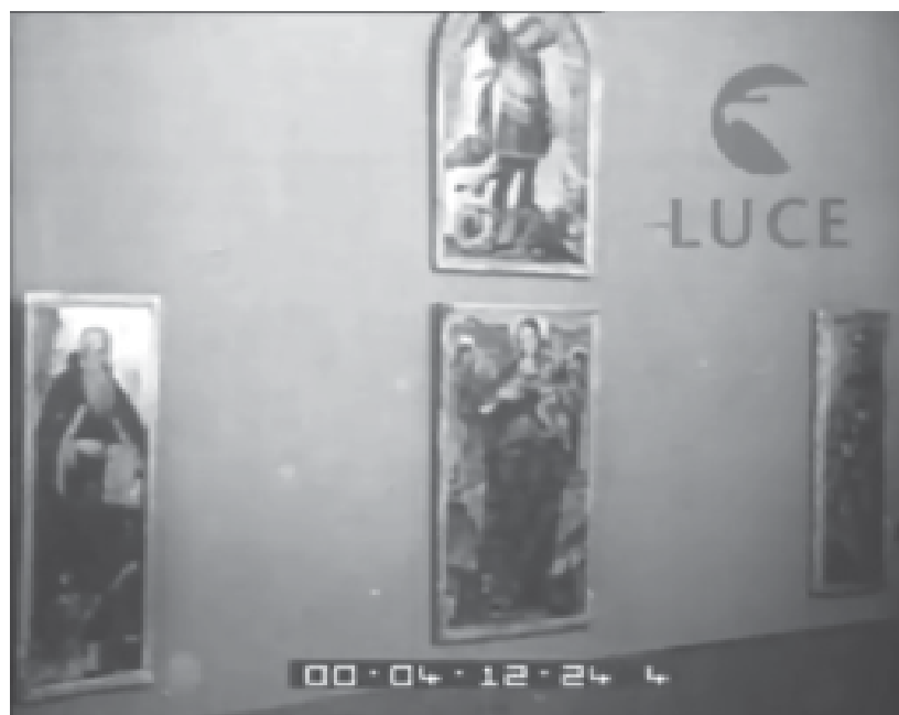
Fig. 5. Il Polittico di Buccino esposto nella II Mostra Salernitana d'Arte (Fotogramma del Giornale Luce B0261 del 05/1933, © Archivio Luce)

dell'amministrazione comunale di Buccino ad affidare le opere in pericolo al costituendo Museo Provinciale 30 . Ad attirare le attenzioni dell'Ortolani furono innanzitutto le quattro tavole che per primo identificò correttamente con la parte superstite del polittico commissionato ad Andrea Sabatini per l'altare maggiore della chiesa 31 .